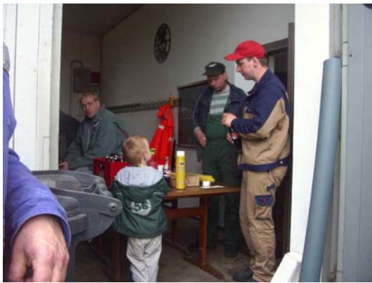
Zwischenzeitlich gab es etwas zur Stärkung