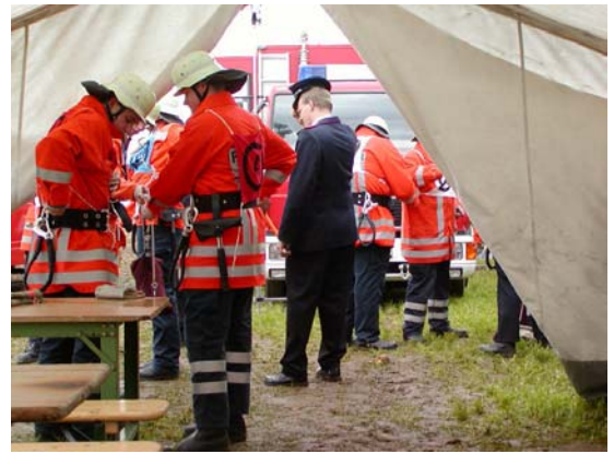
Sonderprüfung – Rettungsknoten