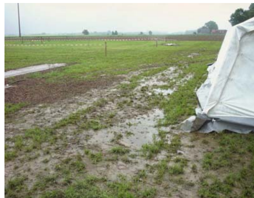
Wasser auf dem Wettbewerbsplatz wohin man schaute

Um den Gästen den Tag so angenehm wie möglich zu gestalten, mussten Zelte und Unterstände aufgebaut werden. Geplant waren ursprünglich ein Getränkewagen, ein Verpflegungsstand und diverse Pavillons als Sonnenschutz sowie ein Vorzelt am Gerätehaus.