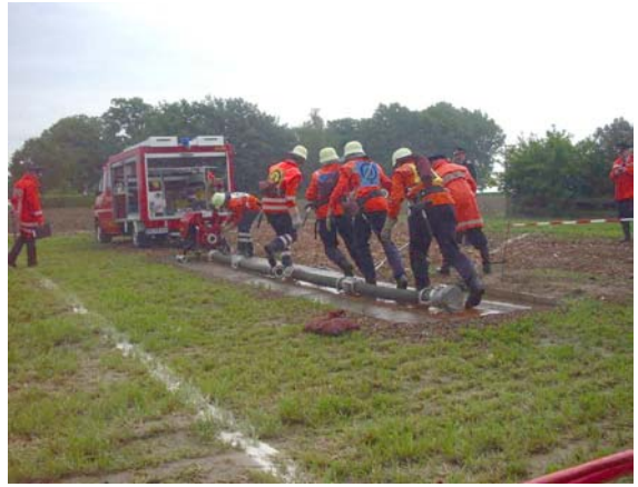
Die Zeit läuft.....!!!!!!