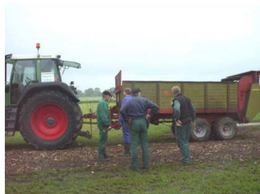
Holzhacksnitzel und immer wieder Holzhacksnitzel