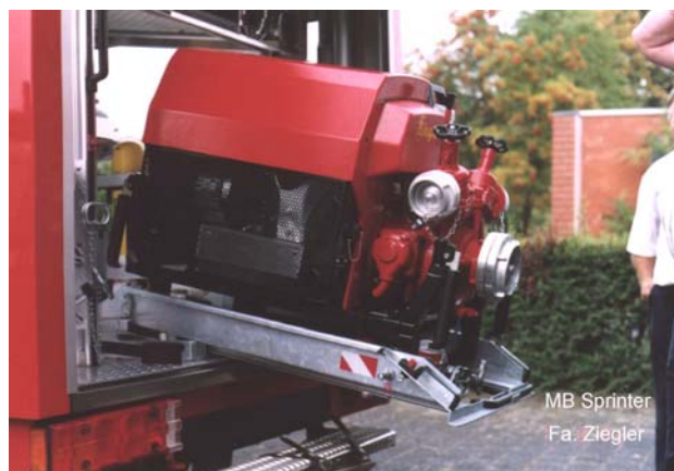
Ausfahrbarer und absenkbarer TS-Schlitten

Die Mitgliederversammlung im Februar 2003 beschloss, diese Ausrüstungsteile aus der Wehrkasse zu finanzieren. Ebenfalls selbst bezahlt wurden die Blitzleuchten statt Drehspiegelleuchten, die zusätzliche 3. Blitzleuchte am Heck, der absenkbarer Schlitten für die Tragkraftspritze, zusätzliche Schlauchtragekörbe und ein kleiner Lichtmast.