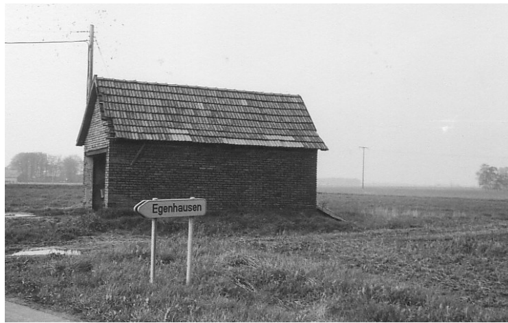
Spritzenhaus an der Egenhauser Straße

Wiedereinmal musste ein neuer Unterstellplatz für den TSA gefunden werden. Hilfe kam 1960 von Fritz Nordmann, Egenhausen. Er stellte ein Gebäude an der Straße Wesenstedt-Göddern als Unterstellplatz zur Verfügung. Bis zum Abriss wurde dieses Gebäude als „Das alte Spritzenhaus“ bezeichnet.