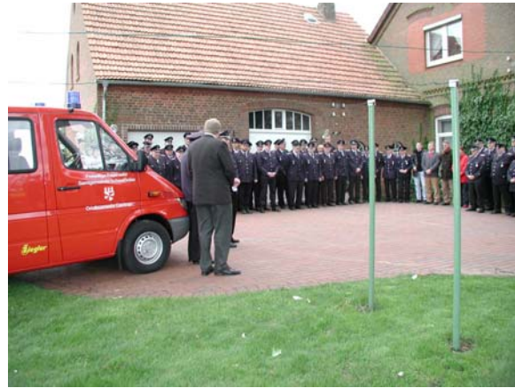
Die Übergabe am 03.05.2003