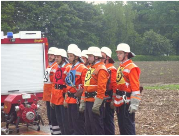
Beginn der Wettbewerbe mit unserer Wettbewerbsgruppe