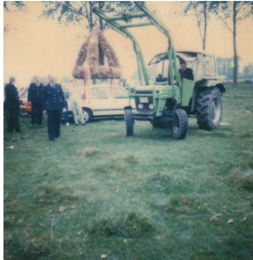
Die Erntekrone wird zum Festzelt gebracht

Das kulturelle Leben in den Ortschaften Egenhausen, Wehrenberg, Cantrup, Hooppe und Gödern wurde ebenfalls von der Ortsfeuerwehr Cantrup geprägt. Sie war Ausrichter des alljährlichen Erntefestes.