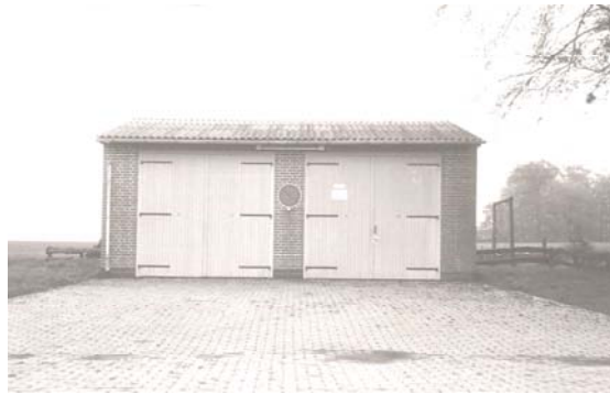
Feuerwehrgerätehaus in Göddern

Gebaut wurde ein schlichtes Feuerwehrgerätehaus mit zwei Einstellplätzen. Auf den Bau von Aufenthaltsraum und sanitären Anlagen musste aus finanziellen Gründen verzichtet werden.