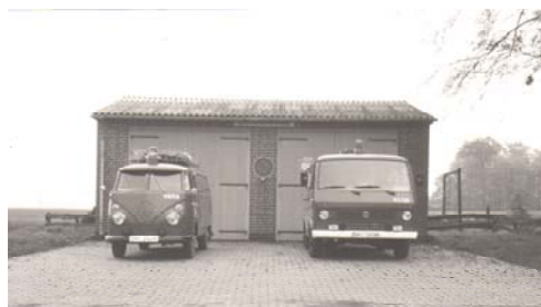
Feuerwehrgerätehaus mit TSF und GW

Das alte TSF-T konnte wegen Durchrostungen am Rahmen und anderen tragenden Bauteilen nicht mehr als Tragkraftspritzenfahrzeug eingesetzt werden. Es wurde von Feuerwehrkameraden in Eigenleistung zu einem Gerätewagen umgebaut.