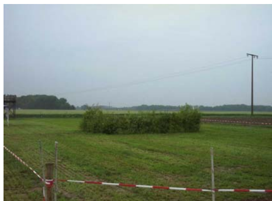
Der Wettbewerbsplatz ist fertig