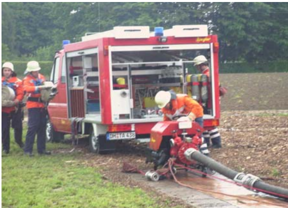
Springt sie an????????????