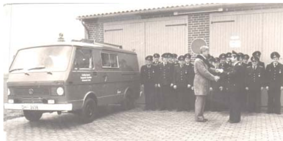
Übergabe des TSF am 15.12.1979

Einen Höhepunkt besonderer Art erlebte die Ortsfeuerwehr Cantrup am 15. Dezember 1979. An diesem Tage wurde das neue Tragkraftspritzenfahrzeug von der Samtgemeinde Schwaförden an die Ortsfeuerwehr Cantrup übergeben. Hierbei handelte es sich um ein VW-Fahrzeug vom Typ LT-28 mit einem Ziegler-Aufbau. Die Besatzungsstärke war von nun an 1 + 5.