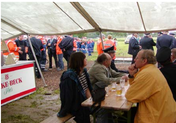
Sonderprüfung der Gäste!!!