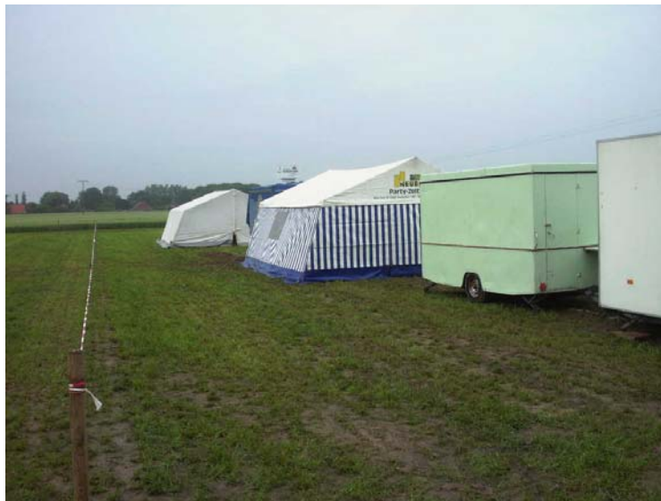
Die Zelt- und Budenburg

Da die Grasnarbe mehr und mehr durchweichte, beschloss man, die Hauptfahrwege mit Holzhacksnitzel zu befestigen. Eine Maßnahme, die sich am Wettbewerbstag sehr bewährte.