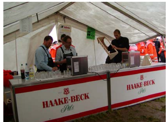
Sie prüfen unsere Gäste

Alle Strapazen der Vortage hatten sich gelohnt. Bei strahlendem Sonnenschein mit nur einem Regenschauer verliefen die Wettbewerbe fair. Die Gäste und Teilnehmer hatten mehr oder weniger für das leibliche Wohl gesorgt. In 11 Jahren werden wieder die Samtgemeinewettbewerbe hier in Cantrup-Göddern stattfinden. Möge der Wettergott dann ein Einsehen mit uns haben.