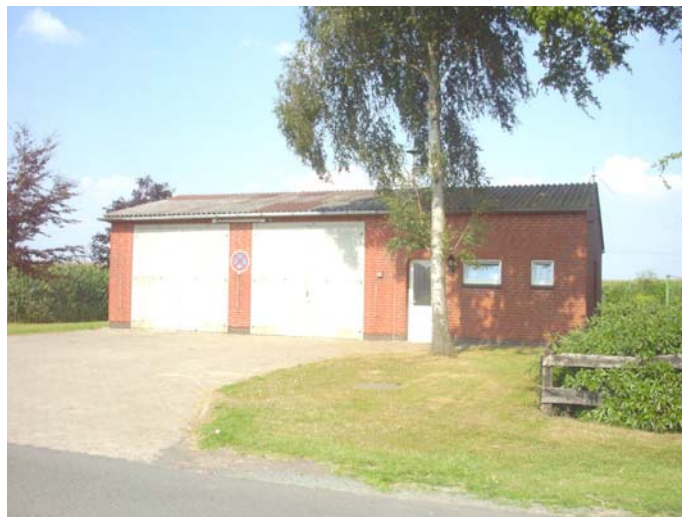
Feuerwehrgerätehaus mit Anbau

Fertigstellung des Anbaus am Feuerwehrgerätehaus. 20.000,- DM hatte der Samtgemeinderat für den Umbau bewilligt. Der Ausbau wurde in Eigenleistung erstellt. Die Ortsfeuerwehr Cantrup verfügt nun über einen Schulungsraum mit integrierter Küche und sanitären Anlagen.